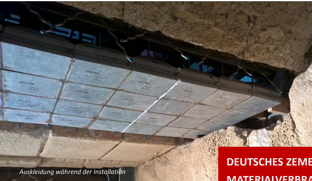
Auskleidung während der Installation

DEUTSCHES ZEMENTWERK REDUZIERT MATERIALVERBRAUCH MIT HASLE'S MODULARER AUSKLEIDUNG.